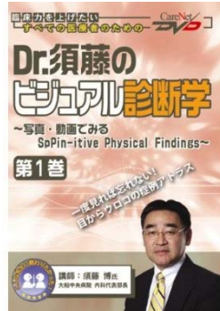
Dr. 須藤のビジュアル診断学 (ケアネットDVD)

1983年和歌山県立医科大学卒業。茅ヶ崎徳洲会総合病院で5年間の内科研修。米国 Good Samaritan Medical Center などで腎臓内科の臨床研修。その後指導医として勤務。1994年より池上総合病院内科、2000年より東海大学医学部総合内科。2006年より現職。